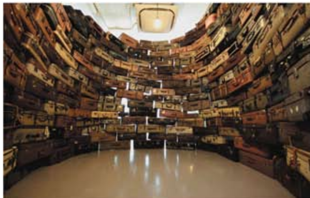
《集積 - 目的地を求めて》2010 KENJI TAKI GALLERYでのインスタレーション

The exhibition will present works concerned with "walls," a theme Shiota has embarked on in recent years. The works arise from her experience of living in Germany far from Japan and her thoughts of how nationality, religion and other categories assigned to individuals are helpful aids for knowing others and ourselves and, simultaneously, unsurpassable walls preventing us from really knowing each other. The featured artworks will also include a boat installation prompted by her experience of the Setouchi region where this museum is located and a video work produced on the basis of interviews with children in Berlin. The exhibition will ask: Where did I come from? What is my existence now and where am I going?