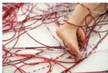
《wall》2010 ©Chiharu Shiota