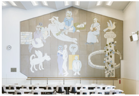
慶應義塾大学学生食堂壁画《デモクラシー》1949 2025