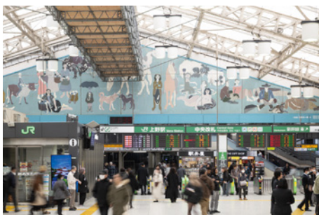
JR上野駅中央改札壁画《自由》1951 2025