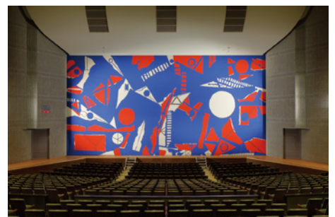
レクザムホール大ホール縦帳《太陽と月の住むところ》1988 2025