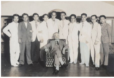
新制作派協会創立会員 1936